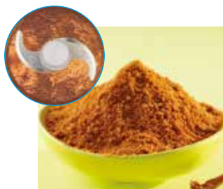
TRITURAÇÃO DE ESPECIARIAS

ESPECIAL para ervas aromáticas e especiarias