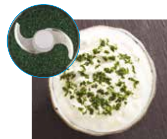
TRITURAÇÃO DE ERVAS AROMÁTICAS